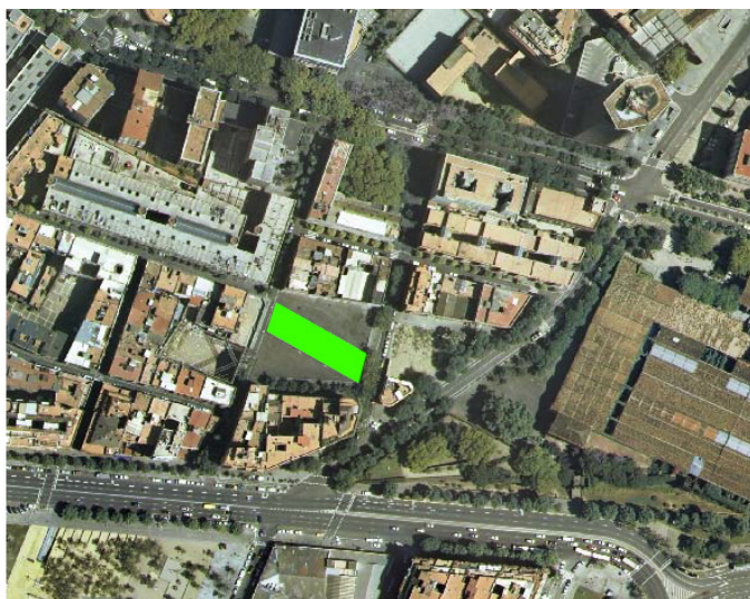
Vista aèria del solar objecte de l'actuació arqueològica.

La Referència Cadastral 0909509DF3800H full 1/500, P187 de l'illa 0150080, del plànol parcel·lari de la ciutat de Barcelona i les coordenades UTM Huso 31 són X: 430973 Y:4580982.