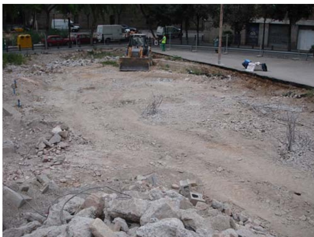
Vista del solar una vegada finalitzats els treballs.

Una vegada acabades les feines de desenrunament es va donar per finalitzada la intervenció.