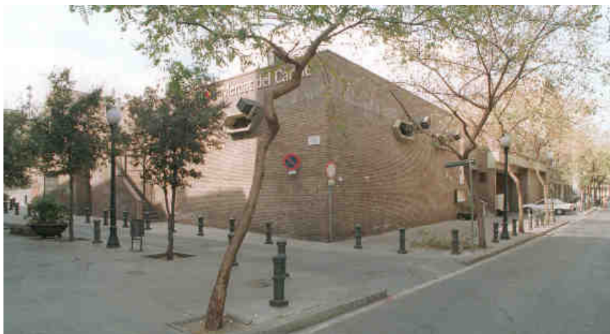
Vista de l'edifici de l'antic Mercat del Carme poc abans del seu enderroc.