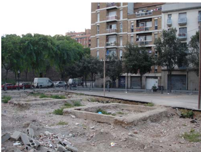
Vista del solar amb les fonamentacions de formigó del Mercat del Carme.

Els murs alternen unes amplades de 30 i 60 cm i s'han documentat amb una alçada de 55 cm per sobre del nivell del solar una vegada rebaixats els terrenys.